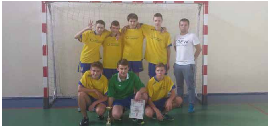
Pierwsze miejsce w powiecie oświęcimskim w halowej piłce nożnej.