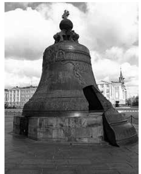
Dzwon „Car Kołokoł III”, waga: 160 t, Rosja, Moskwa, wysokość: 6,14 m. [źródło: https://en.wikipedia.org/wiki/Tsar_Bell , licencja: CC BY 4.0]