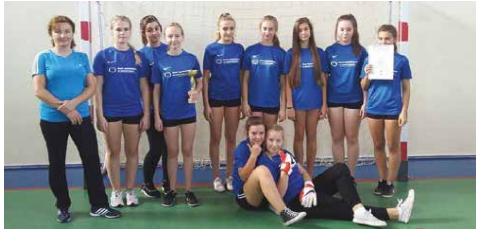
Mistrzyni powiatu i rejonu w halowej piłce nożnej.