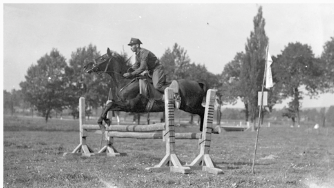
Bieg z przeszkodami