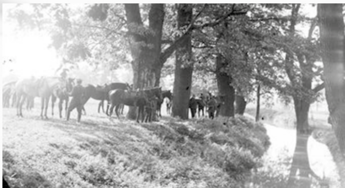
Odpoczynek po zawodach w parku przyspałacowym