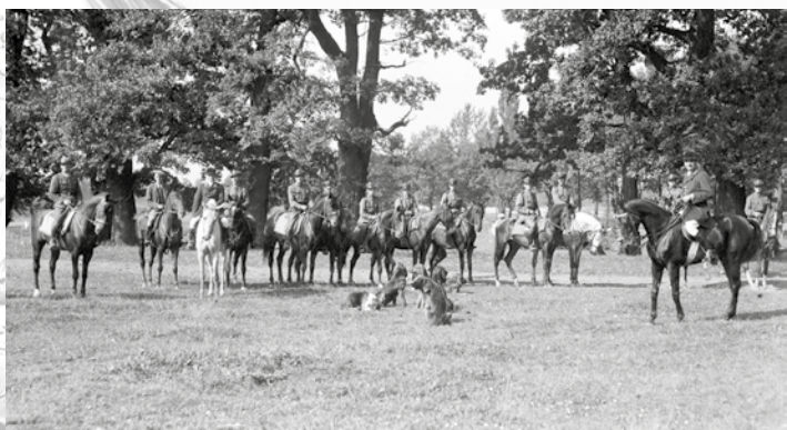
Uczestnicy zawodów zebrani w parku osieckim po zakończeniu zawodów