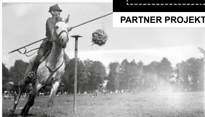
Konkurencja władania lancą