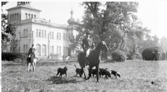
Wyjazd na zawody konne – prowadzi major Eryk PFANN