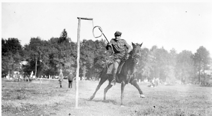
Uczestnicy zawodów w konkurencji władania lancą