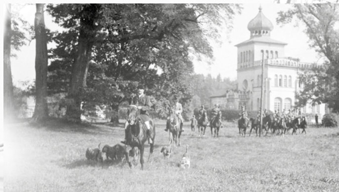
Myśliwi z psami pod pałacem, wyjazd na zawody konne – prowadzi major Eryk PFANN