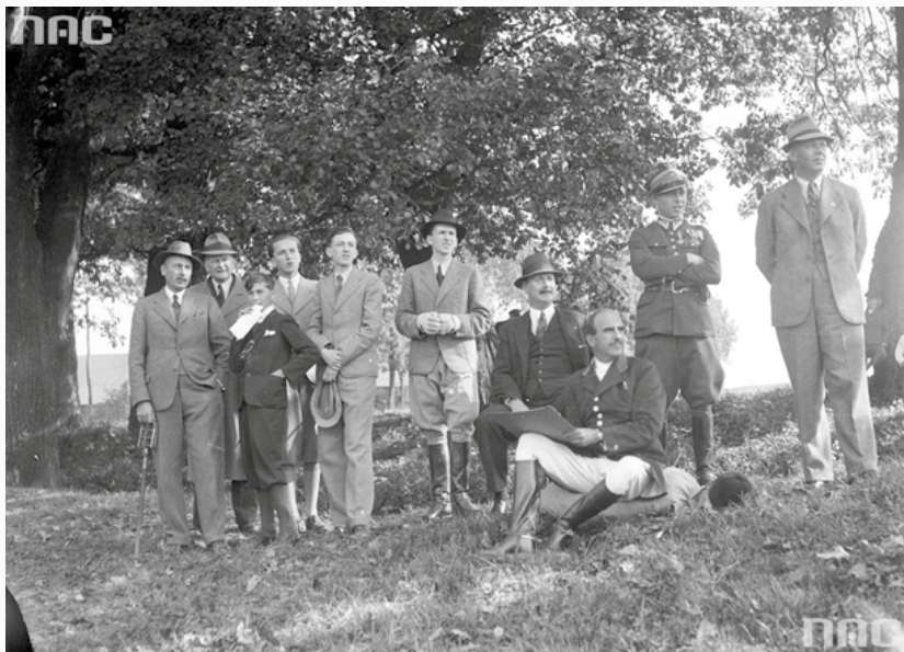
Jury zawodów konnych w Osieku Kim byli uczestnicy jury: