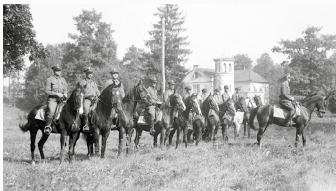
Zawodnicy w szeregu przed zawodami