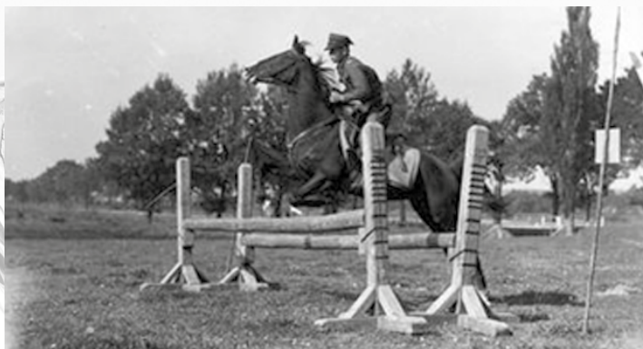
Uczestnik zawodów w skoku przez przeszkodę