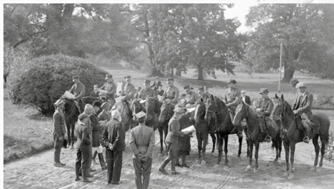
Wręczenie nagród zawodnikom uczestnikom zawodów.