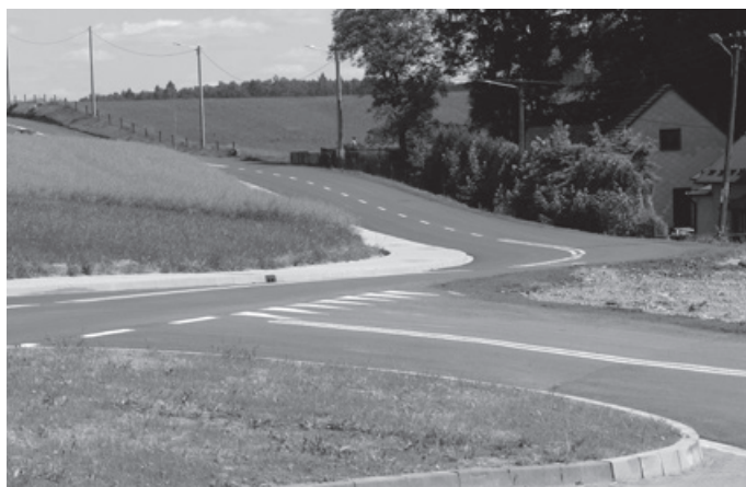
ul. Kościelna - Osiek

Łączny koszt wykonania UL. KOŚCIELNEJ wraz z chodnikiem i UL. PRZECZNICA wyniósł 1.022.478,12 zł.