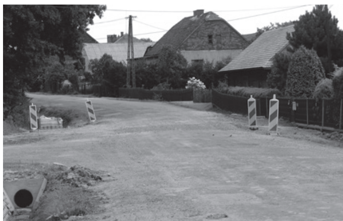
ul. Zamkowa - Głębowice