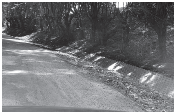
ul. Zamkowa - Głębowice