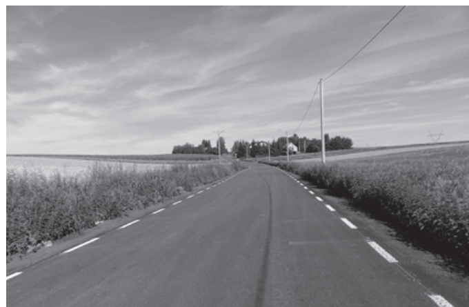
ul. Przecznicza - Osiek