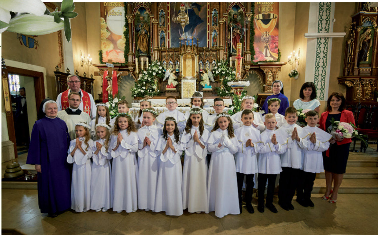
ZSP Nr 1, Klasa IIIa