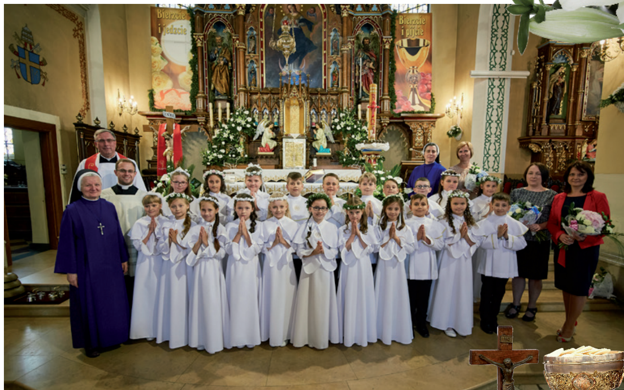
ZSP Nr 1, Klasa III d