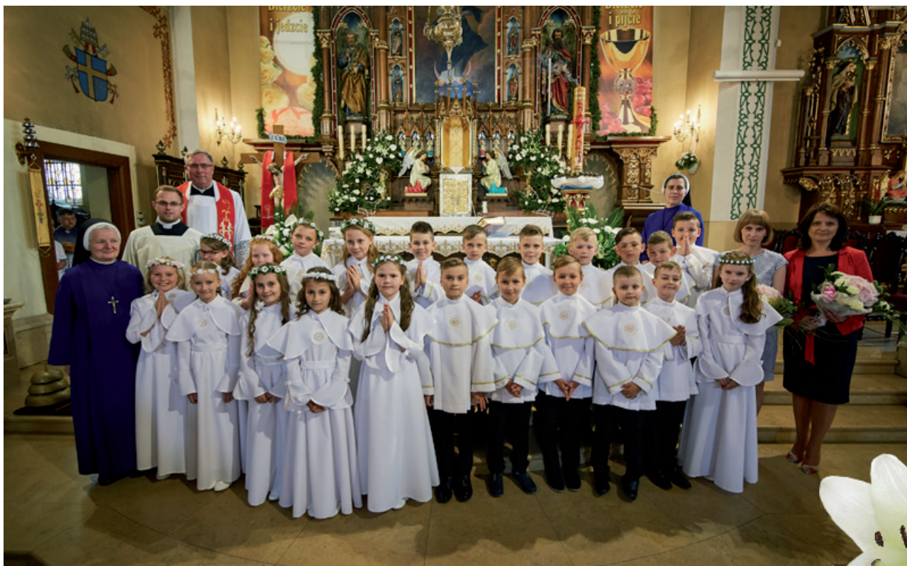
ZSP Nr 1, Klasa IIIc