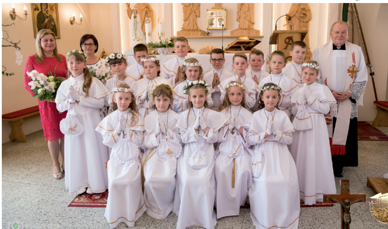
SP NR2, klasa III