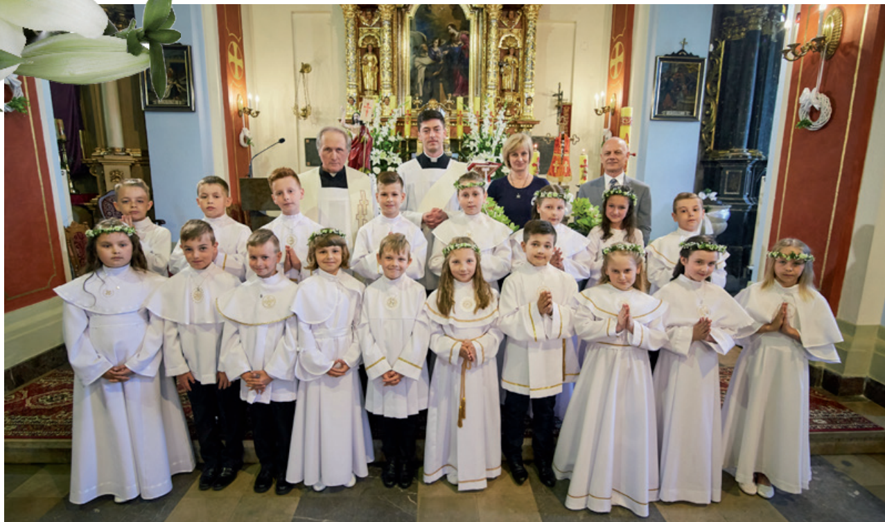
ZSP Głębowice I Komunia Święta