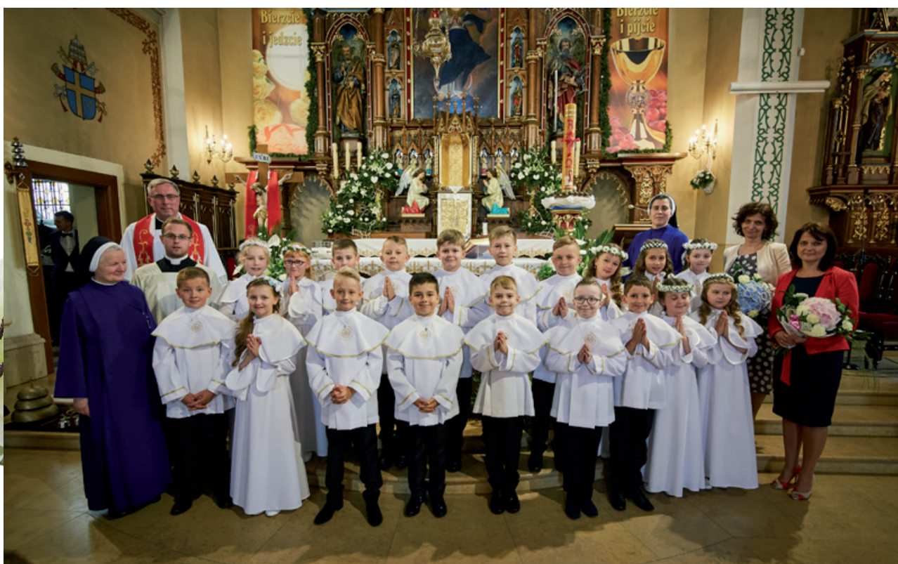
ZSP Nr 1, Klasa IIIb