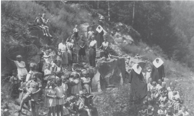
Dzieci z ochronki prowadzonej przez Siostry Służebniczki