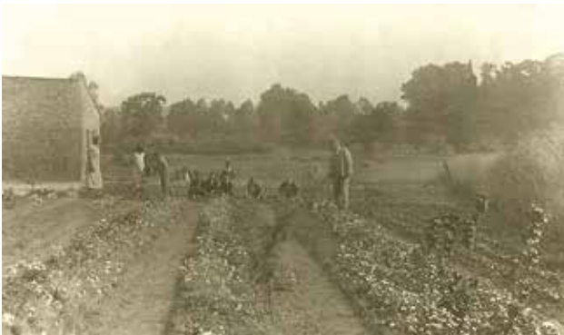
Ogródek przy szkole w Osieku Dolnym

Wkrótce władze PRL zlikwidowały Katolickie Stowarzyszenie Młodzieży, a 31 października 1961 zwolniono siostry z pracy w ochronce działającej pod szyldem „Przedszkole Caritas”. 1 listopada ich etaty przejął personel świecki. Po kilku dniach liczba dzieci zmniejszyła się do siedmiorga. Rodzice powiedzieli, że do takiego przedszkola, gdzie nie ma godła naszej świętej wiary, dzieci nie będą posyłać, więc 16 grudnia 1961 r. przedszkole zostało zamknięte, a jego wyposażenie