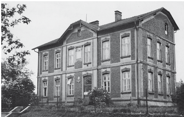
Budynek szkoły w Osieku Górnym

Wybudowano budynek gospodarczy, gdzie mieściły się ubikacje dla uczniów. Przez kilka lat dzieci uczyły się też w wynajmowanych pomieszczeniach prywatnego domu obok szkoły. Staraniem kierownika szkoły i rodziców wybudowano drugi budynek szkolny służący dzieciom do 2002 r., kiedy to przeniesiono szkołę do nowego budynku. W 2008 r. oddano do użytku salę gimnastyczną, a po remoncie starego budynku połączono je, tworząc piękny kompleks szkolno-przedszkolny.