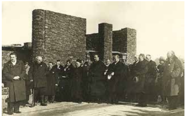
Wmurowanie kamienia węgielnego pod budowę szkoły w Osieku Dolnym