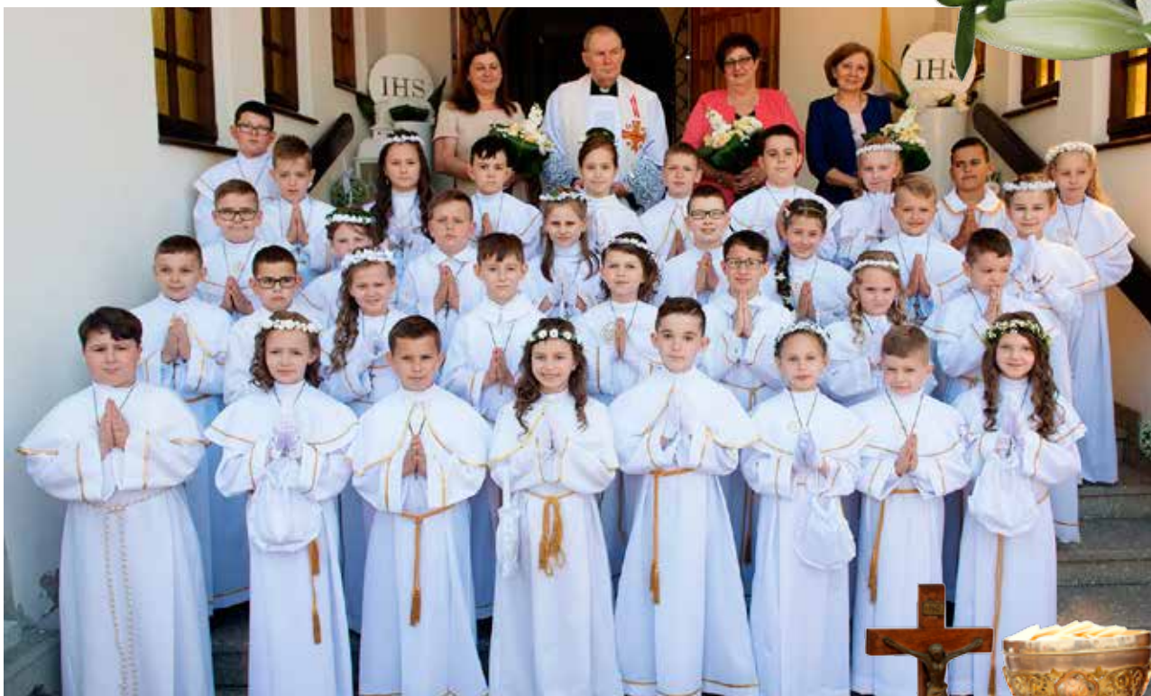
SP nr. 2 w Osieku - klasa 3