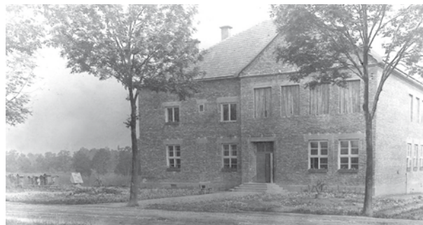
Budynek szkoły w Osieku Dolnym w 1936 r.