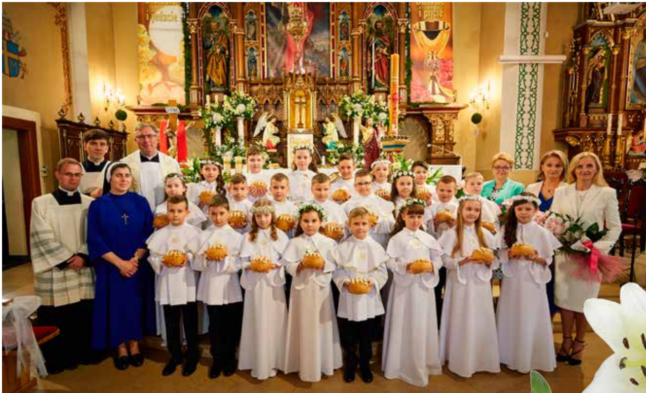
SP nr2 w Osieku-klasa 3a i 3b