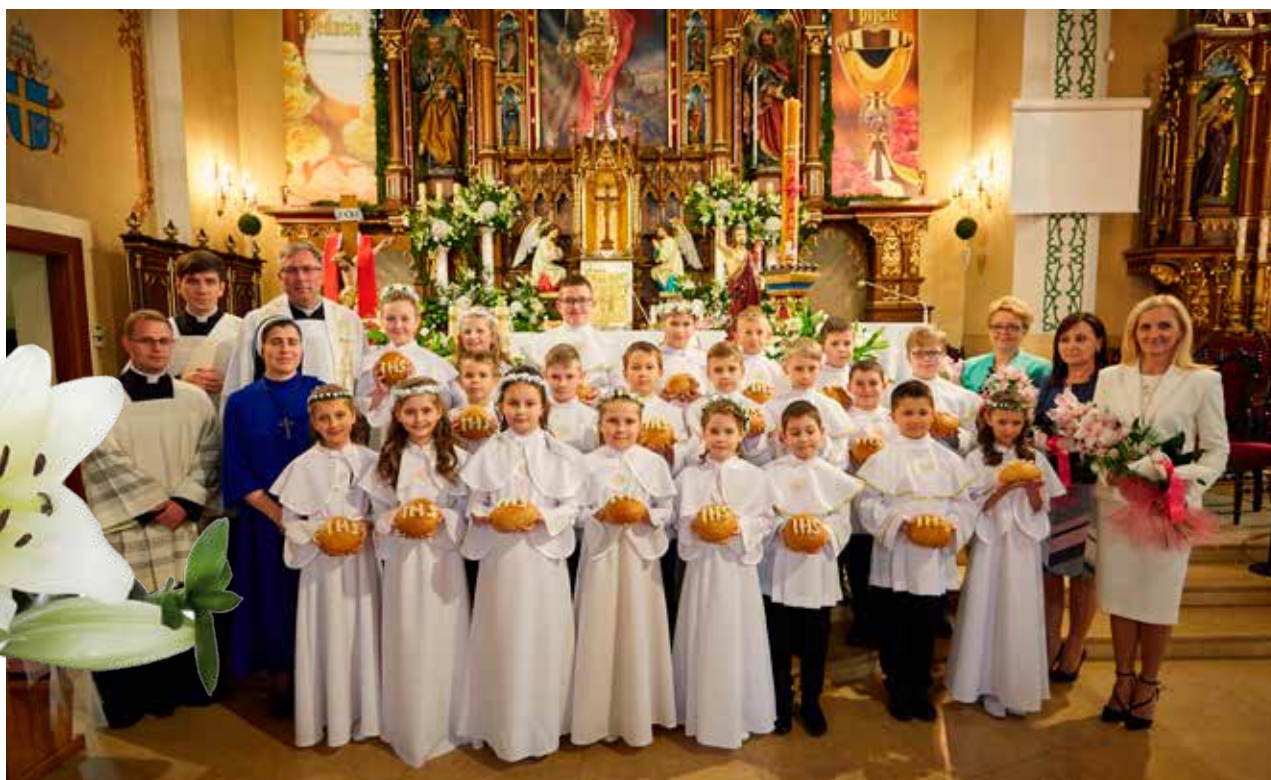
ZSP nr. 1 w Osieku - klasa 3b