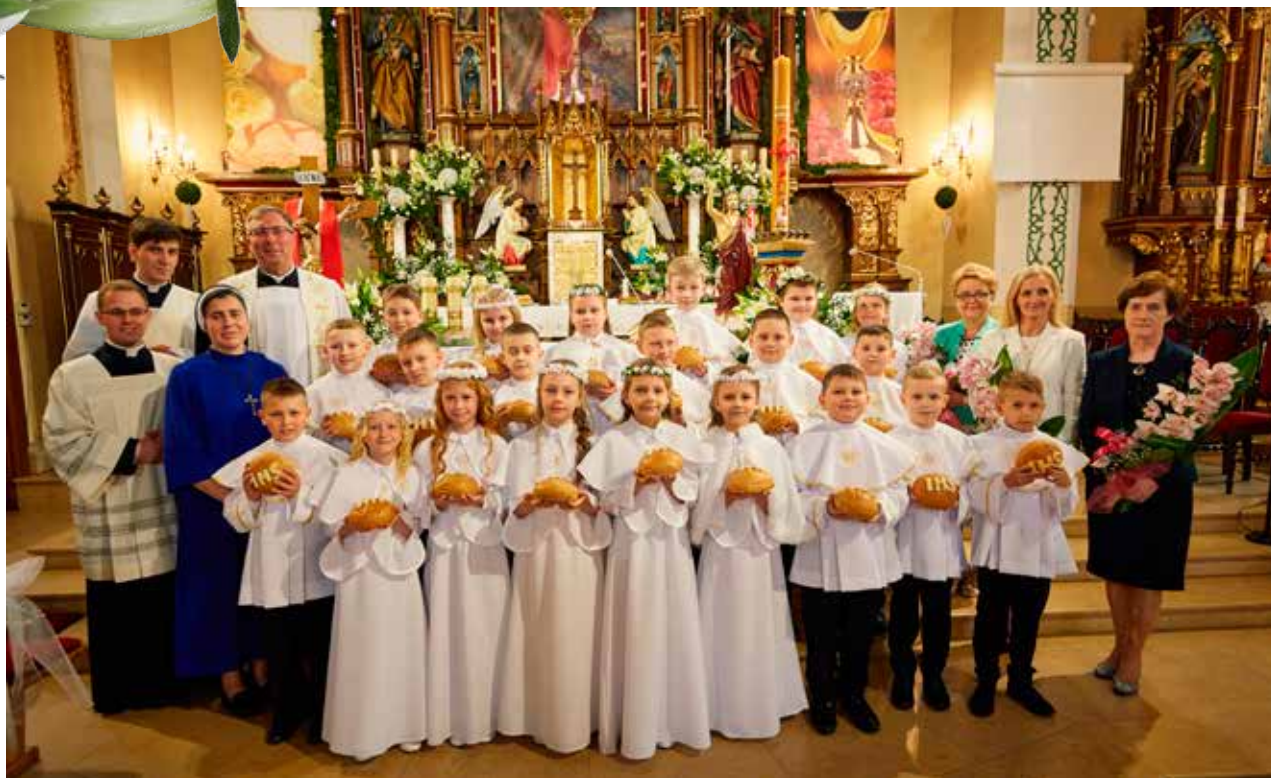
ZSP nr. 1 w Osieku - klasa 3a