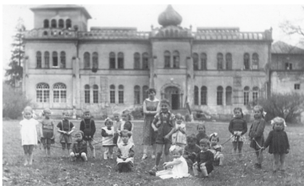
Grupa przedszkolna przed zamkiem