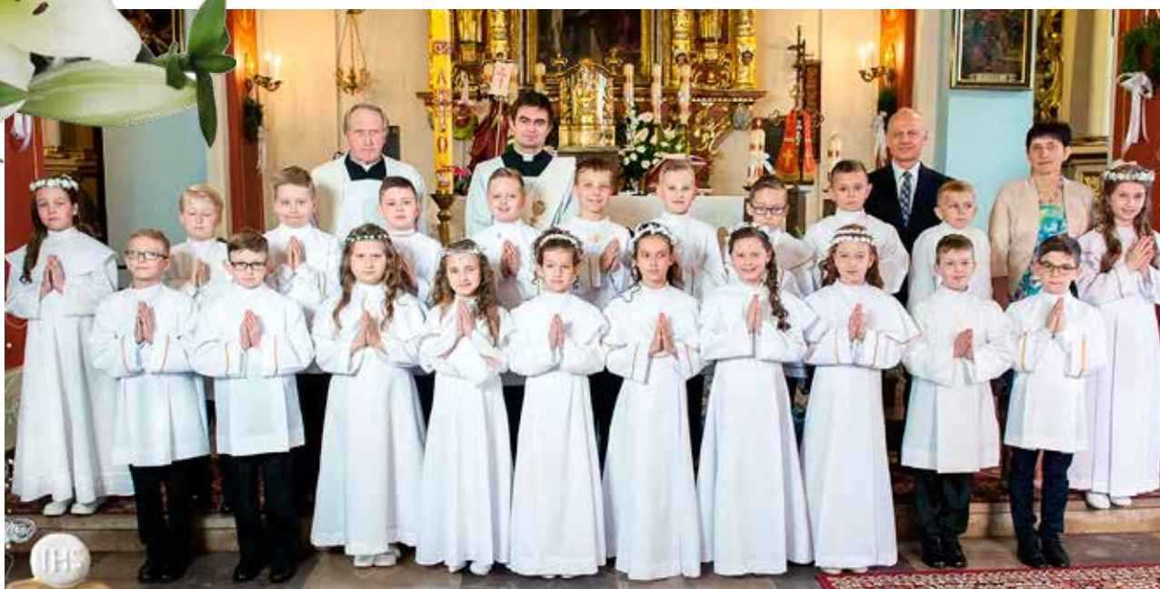
ZSP Głebowice-klasa 3