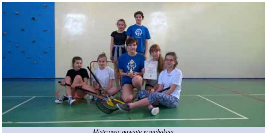
Mistrzowie powiatu w unihokeja