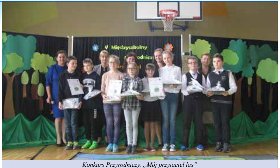
Konkurs Przyrodniczy. „Mój przyjaciel las”

Uczniowie każdej ze szkół biorących udział w konkursie wykazali się dużą kreatywnością, talentem plastycznym oraz ogromną wiedzą. I miejsce zajął zespół z ZSP w Głębolicach, na II miejscu uplasowała