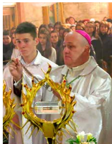
Głębowice, fot. ks. Jacek Pędziwiatr (Gość Niedzielny)