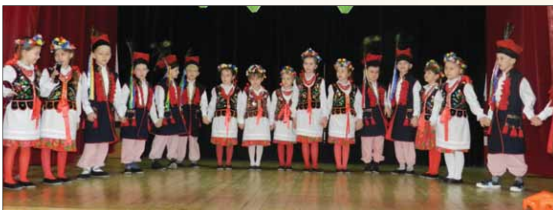
Przedszkolaki z ZSP w Głębowicach uświetniły uroczystość Dnia Kobiet