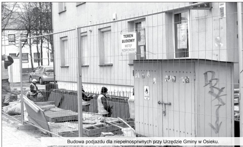
Budowa podjazdu dla niepełnosprawnych przy Urzędzie Gminy w Osieku.

Pozwolenie na zbiórkę publiczną może być udzielone jedynie stowarzyszeniom i organizacjom posiadającym osobowość prawną, np. fundacjom albo komitetom. Pozwolenie na zbiórkę publiczną może być udzielone tylko wówczas, gdy cel zbiórki nie jest sprzeczny z prawem oraz z punktu widzenia interesu publicznego jest godny poparcia. Za takie cele uważa się przede wszystkim cele: religijne, państwowe, oświatowe, zdrowotne, kulturalno-społeczne i społeczno-opiekuńcze. Zbiórki publiczne, urządzone w interesie osobistym, (dla siebie) są zabronione.