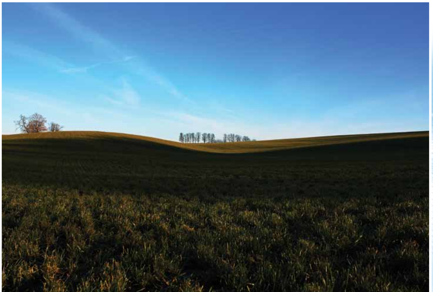
24 grudnia 2013 r. w Osieku „WIOSNA ZIMĄ”