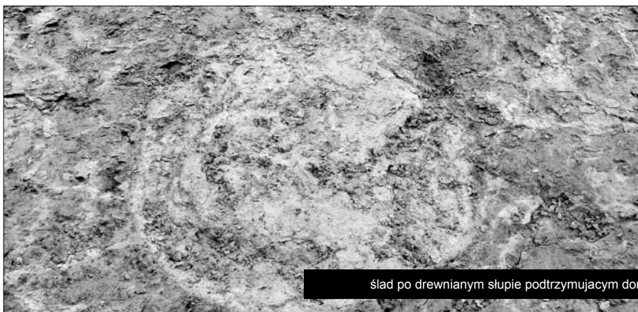
ślad po drewnianym słupie podtrzymującym dom