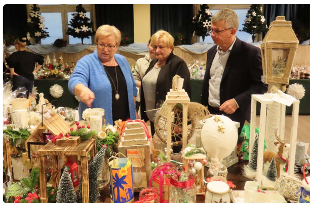
Komisja oceniająca prace konkursowe